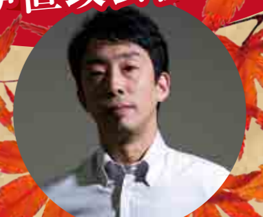
俳優 北村 有起哉さん