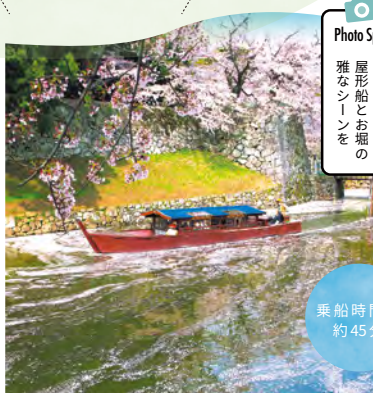
Photo Spot ゆったりと進む 優雅なシーンと お堀の

080-1461-4123(NPO法人小江戸彦根) 彦根市金亀町 玄宮園前船着場 10:00~15:00(土日祝日は16:00まで) 毎時00分発 ※冬期は予約運航になります 大人1,500円、小学生以下700円 ※桜の期間中は料金が異なります 年末年始 ※運航状況については公式HPでご確認ください